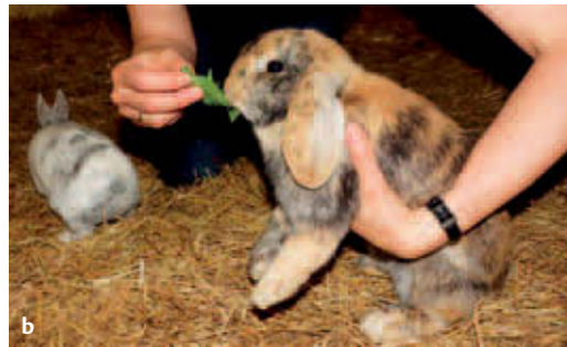
► Abb. 4.2 Schrittweise Gewöhnung an das Hochheben.

a Das Kaninchen wird sanft mit der linken Hand umfasst, während es mit Löwenzahn gefüttert wird.