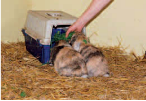
► Abb. 4.4 Die Transportbox steht im Aufenthaltsbereich der Kaninchen. Mit begehrtm Futter kann der Aufenthalt in der Box angenehm gestaltet werden. Dies ist die beste Voraussetzung für das Transporttraining.