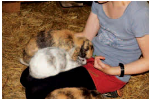
► Abb. 4.3 Diese Kaninchen kommen freiwillig auf den Schoß, da sie mit Grünfutter gelockt wurden.

Zeigt ein Kaninchen ängstliches Verhalten oder Angstaggression gegenüber dem Besitzer, kann eine Desensibilisierung und (klassische) Gegenkonditionierung durchgeführt werden. Vorab sollte man die Hände mit benutzter Streu (oder auch Urin) der Tiere einreiben, sodass ein vertrauter Geruch entsteht. Zeigt das Kaninchen bereits bei der Annäherung des Besitzers Fluchtverhalten, setzt man sich erst einmal ruhig vor den Käfig oder in das Gehege und füttert das Tier (notfalls zuerst durch das Gitter) mit begehrtm Futter wie Löwenzahn oder Karottenstücken. Frisst es nicht aus der Hand, kann man das Futter in die Nähe des Tieres legen und erst einmal ruhig abwarten. Nach und nach kann dann der Abstand des Futters zum Menschen verringert werden. Schritt für Schritt wird das Kaninchen immer näher am Körper gefüttert, bis es aus der Hand frisst und schließlich auf dem Schoß oder neben dem Besitzer sitzt, um sein Futter zu fressen. Dabei ist zu beachten, dass das Kaninchen nicht bedrängt wird, sondern dass die Anwesenheit des Menschen immer nur mit positiven Empfindungen verbunden wird. Dazu gehört auch, dass ein Kaninchen nie zum Schmusen gezwungen wird, sondern nur gestreichelt wird, wenn es freiwillig kommt. Auch auf den Schoß sollte es nicht gezwungen, sondern immer nur gelockt werden (► Abb. 4.3 ).